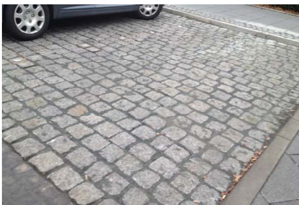
HanseGrand Fugensand grau

Es handelt sich um Hartgestein-Brechsande Körnung 0/2-0/5 mm, mit einer exakt abgestimmten Körnungslinie, vermischt mit dem natürlichen Bindemittel Stabilizer, welche im Vergleich zur reinen Brechsand-Nachverfugung zu einem widerstandsfähigeren Fugenverschluss führen, ohne jedoch starr zu werden. Stabilizer ist ein Naturprodukt und kann überall eingesetzt werden. Als Fugensandprodukt gilt er als inerter Baustoff.